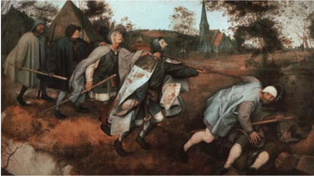
ABBILDUNG 1: Pieter Brueghel d. Ä., Die Parabel von den Blinden (1568) Museo Nazionale di Capodimonte, Neapel