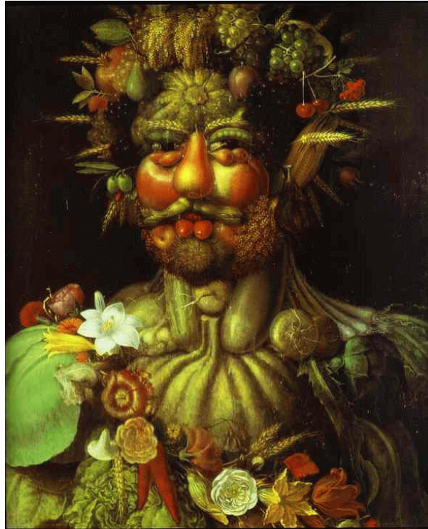
ABBILDUNG 2: Giuseppe Arcimboldi, Vertumno (1591) Skokloster, Styrelsen, Stockholm

Kris Tanzberg, bildnis rudolfs des zweiten