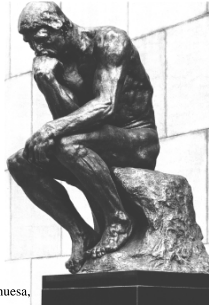
ABBILDUNG 6: Auguste Rodin, Le penseur (1876), Musée Rodin, Paris