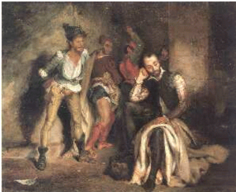
ABBILDUNG 4: Eugène Delacroix, Tasso im Gefängnis (1864), Sammlung Bührle, Zürich

Mein Favorit in dieser Kategorie ist ein Sonett, mit dem der französische Dichter Baudelaire das Bild eines älteren Landsmannes deutet, der seinerseits das Schicksal eines 250 vor ihm lebenden Dichters in Erinnerung ruft: