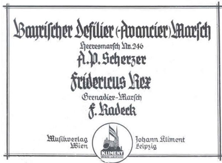
ABBILDUNG 15: Deckblatt und Klavierauszug des zitierten Marsches