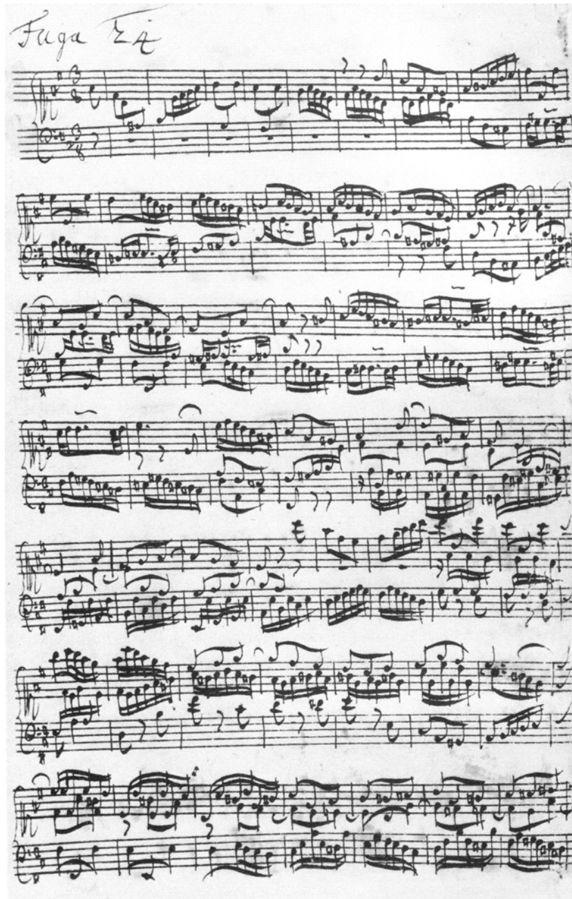
Fuge 24, Seite 1, in Bachs Handschrift. Deutsche Staatsbibliothek Mus. ms. Bach P415, folio 3v.